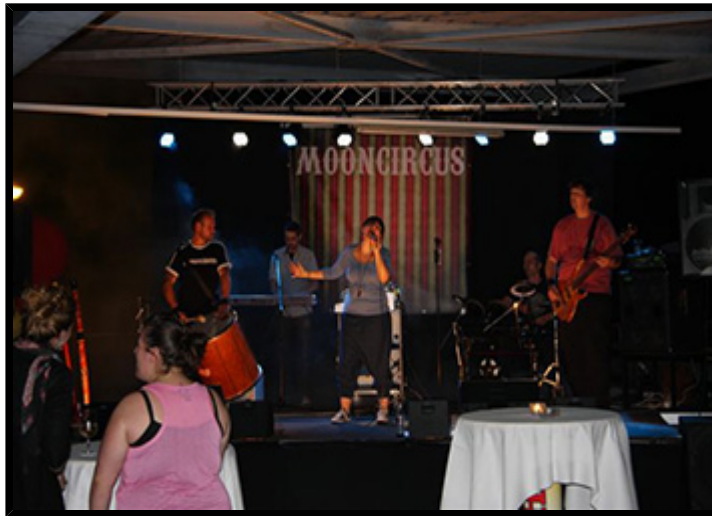
Sorgten für Zirkus bis die Hüter des Gesetzes einschritten.... Mooncircus am Mitternachtsturnier in Luzern - kurz vor Mitternacht...